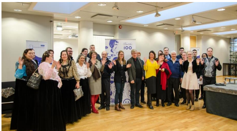
Helsingin tilaisuuden 9.3.2017 hymyilevä joukko.

Tilaisuudessa nostettiin esiin asenteiden merkitys sekä pääväestön taholta romaneihin että romanien taholta pääväestöä kohtaan. Konkreettiseksi tavaksi asenteiden muuttamiseen todettiin aidot kohtaamiset esimerkiksi lasten harrastusten ja koulunkäynnin myötä, jotka antavat mahdollisuuden tutustua ihmisiin ja lieventää mahdollisia ennakkoluuloja. Lähestyvät kunnallisvaalit kirvoittivat osallistujia rohkaisemaan romaneja osallistumaan politiikkaan ja hyödyntämään omaa asiantuntemustaan yhteiskunnan kehittämistyössä.