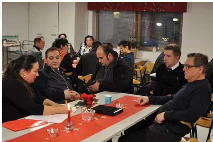
Alueellisia painopisteitä käsiteltiin työpajoissa Rovaniemellä.

Ryhmäkeskusteluissa nousivat esiin eri Lapin kuntien väliset erot ja yhtäläisyydet. Osallistujat toivat aktiivisesti esiin kehittämisehdotuksia, joista toivottavasti jäi kytemään ideoita jatkoa ajatellen. Laajempi kooste tilaisuudesta tullaan julkaisemaan romani.fi/sanoistatekoihin nettisivuilla.