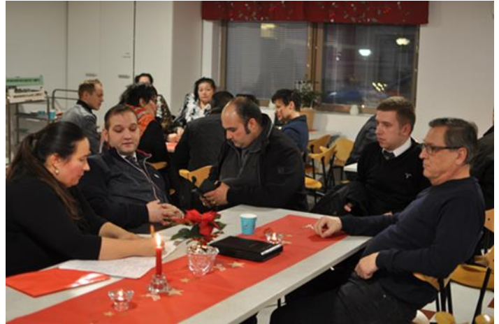
Regionala prioriteringar behandlades i workshoppar i Rovaniemi.

I likhet med de evenemang som ordnades under det föregående projektet, använde man sig även i Rovaniemi av coachningsföretaget Monkey Business dialogmetod. Deltagarna delade in sig i workshoppar, där de diskuterade vilka punkter i programmet för romsk politik som är viktiga med tanke på romernas vardag i landskapet Lappland. De diskuterade också erfarenheter av hur väl de offentliga tjänsterna fungerar samt delade med sig av exempel på olika samarbetsnätverk och många olika former av arbete med romer. De kom också med idéer till årets sommarläger.