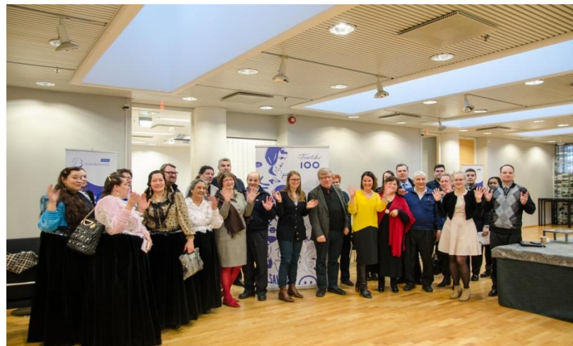
Deltagarna i Helsingfors.

På evenemanget lyftes fram betydelsen av attityder – både majoritetsbefolkningens attityder mot romer och romers mot majoritetsbefolkningen. Ett konkret sätt att förändra attityder ansågs vara genuina möten till exempel i samband med barns hobbyer eller skolgång vilka ger en möjlighet att bekanta sig med människor och skingra eventuella fördomar. Förestående kommunalvalet fick deltagarna att uppmuntra romer att delta i politik och utnyttja sin sakkunskap för att utveckla samhället.